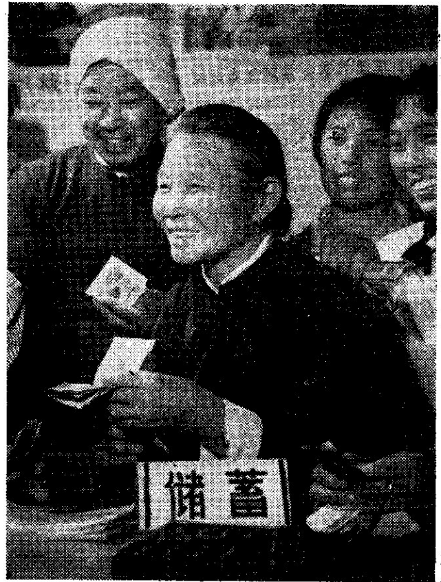
Una sucursal de depósito bancario en una comuna popular rural.

La centralización y la unificación del renminbi se expresan principalmente en los siguientes aspectos: Se usa unificadamente en el mercado nacional para la cotización de los precios, la circulación y el ajuste de cuentas en los arreglos económicos entre los diversos departamentos de la economía nacional. A ningún valor, título, oro, plata o divisas se les permite circular en el mercado. El derecho de emitir el renminbi está centralizado en el Gobierno Popular Central mientras el Banco Popular de China hace una emisión unificada según los planes aprobados por el Estado. Las leyes del Estado estipulan que exceptuándose los pequeños montos de pagos que se pueden hacer al contado, las cuentas de todos los demás arreglos económicos entre las empresas, entidades públicas, organismos gubernamentales y unidades del ejército deben ser hechas mediante los bancos populares locales. Salvo una pequeña cantidad de monedas para pagos menores, todos sus ingresos en dinero efectivo deben ser depositados oportunamente en los bancos populares. Pueden retirarlos del banco sólo cuando pagan los salarios de los obreros y empleados o los departamentos comerciales compran